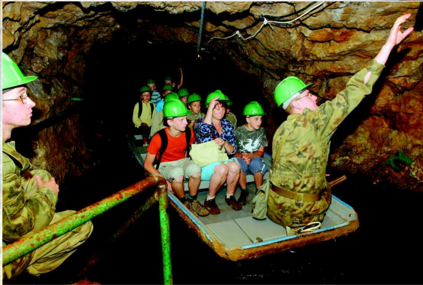
Największe wrażenie na zwiedzających robi spływ łodzią po zatopionych sztolniach Osówki i Włodarza.