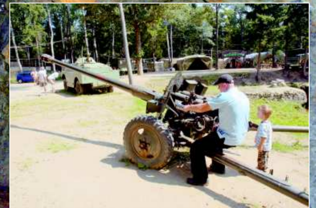
Zgromadzone przed wejściem do sztolni militaria fascynują zarówno dzieci jak i dorosłych.

brakuje również kuchni polowych z typowo wojskowymi smakowitkami. Najważniejszy jest jednak przekaz historyczny i uświadamianie turystom, że były to miejsca gdzie pracowali i ginęli więźniowie obozu koncentracyjnego Gross-Rosen.